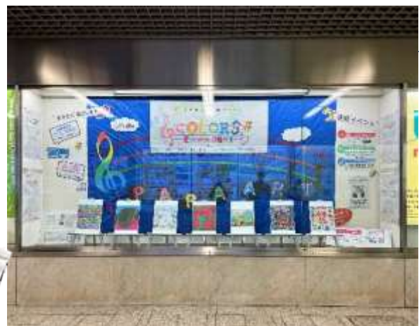
「Colors かわさき展」での展示風景