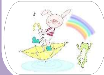
ことぶきキャラクター ことぶき6月バージョン