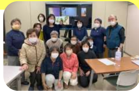
3月に行われた研修のひとコマ

6/14(水)18:00～19:30 本部2階会議室 感染症、食中毒の予防と防止 介護技術(聖風苑デイサービスの場所を借りて実施)