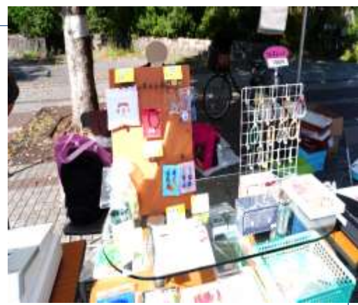
稲毛神社内の一角に販売ブースを設け、 オリジナルの作品を販売しました。