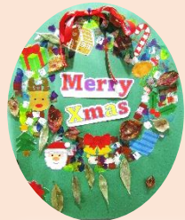
クリスマスリース