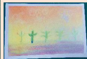
3色パステル 「冬の山」「夕焼け」